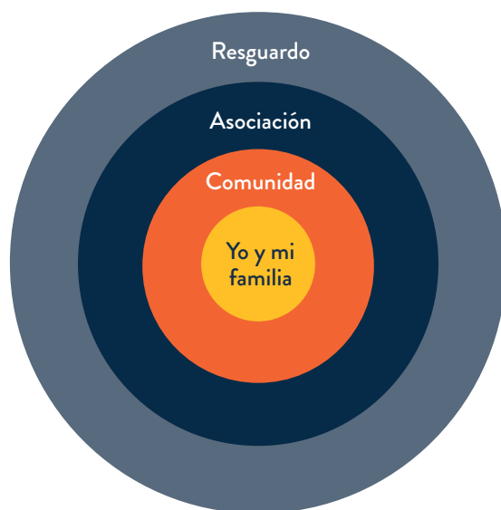
Figura 1. Formación por niveles contextuales

El aprendizaje de las competencias interculturales atraviesa diferentes niveles de responsabilidad y complejidad. Se parte de las comprensiones y acciones en el contexto más cercano a los estudiantes, de manera que al consolidar este aprendizaje se pueda avanzar con solidez y coherencia a niveles más complejos, que involucren la comprensión y acción sobre las situaciones que vive su comunidad, la asociación y el resguardo.